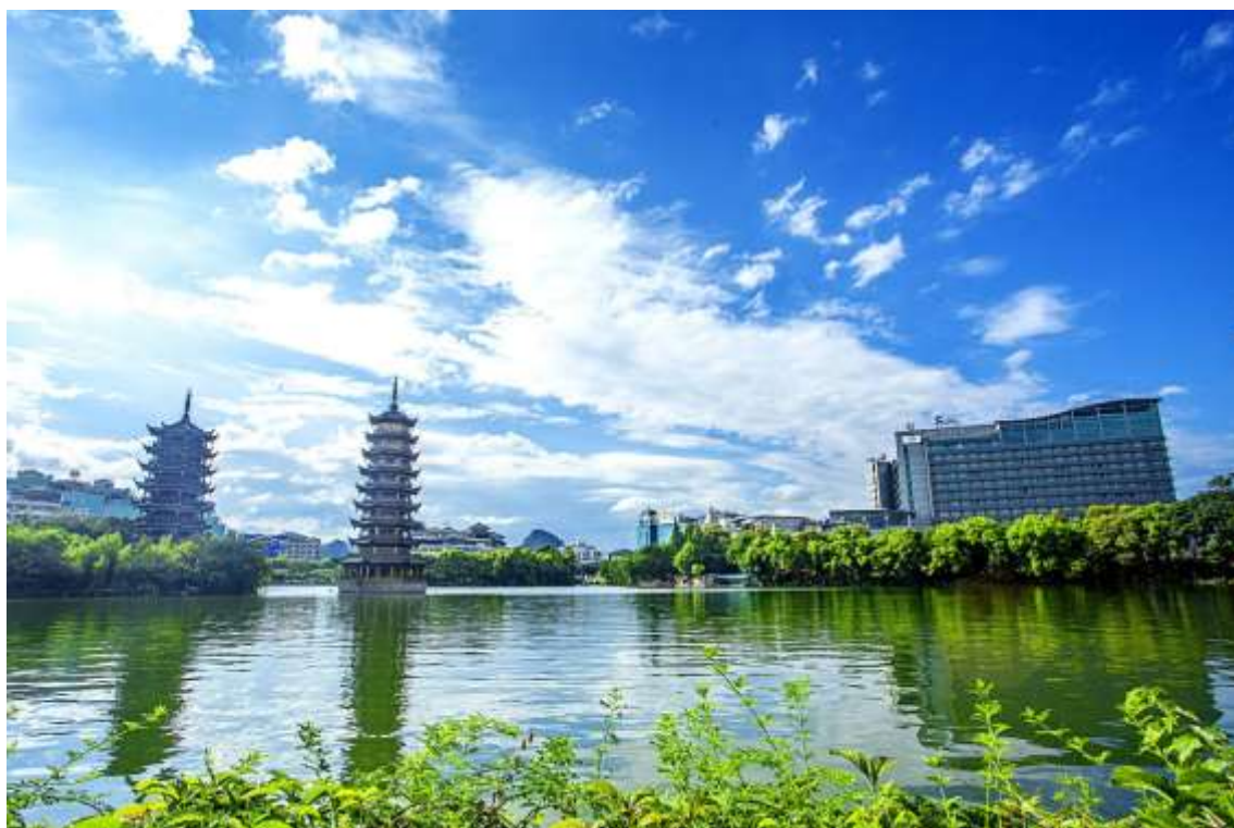
HOTEL GUILIN LIJIAN WATERFALL 5* O SIMILAR

Precios, servicios y demás información de los productos detallados en esta página y en el sitio web www.samarmagictours.com no son vinculantes y pueden cambiar sin previo aviso