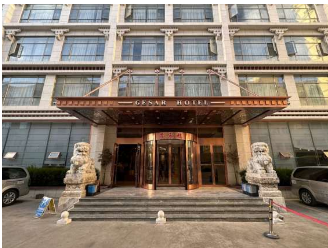
HOTEL GESAR 4* EN SHIGATSE O SIMILAR

Precios, servicios y demás información de los productos detallados en esta página y en el sitio web www.samarmagictours.com no son vinculantes y pueden cambiar sin previo aviso