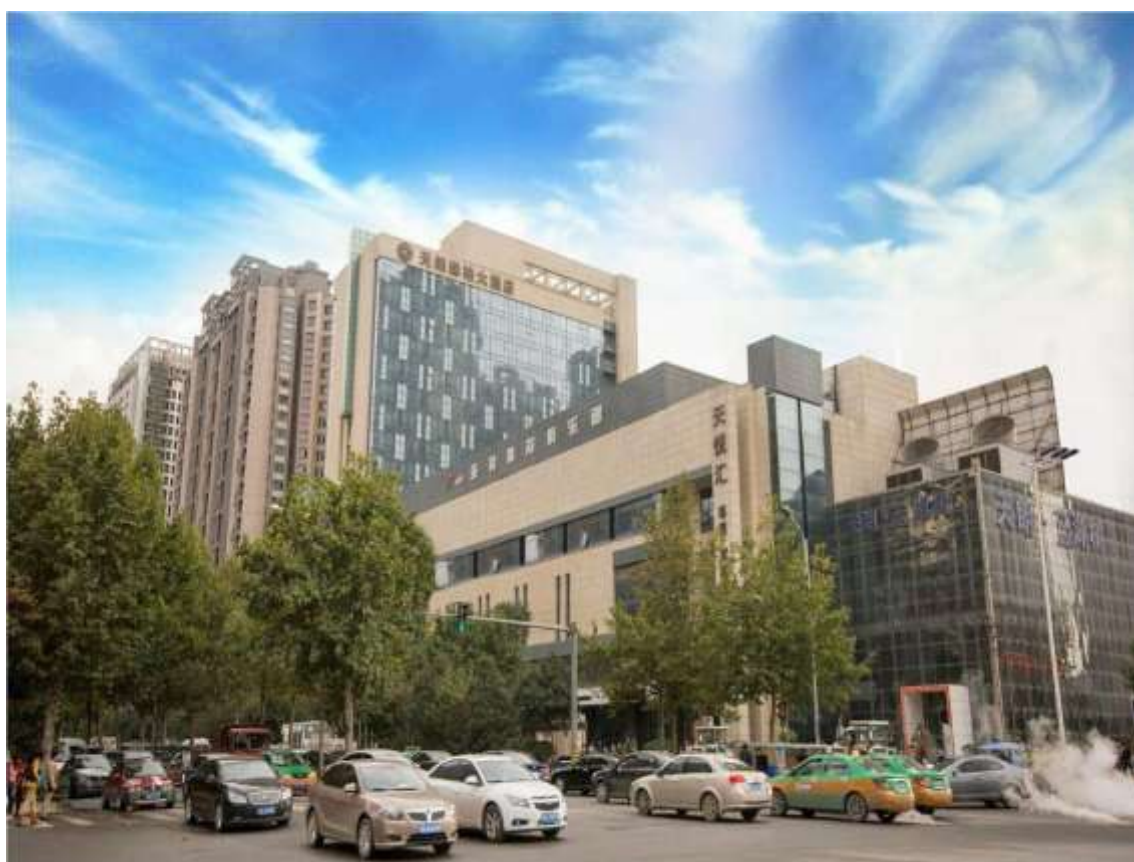
HOTEL XI'AN (SHAANXI) TITAN CENTRAL PARK 5* O SIMILAR

Precios, servicios y demás información de los productos detallados en esta página y en el sitio web www.samarmagictours.com no son vinculantes y pueden cambiar sin previo aviso