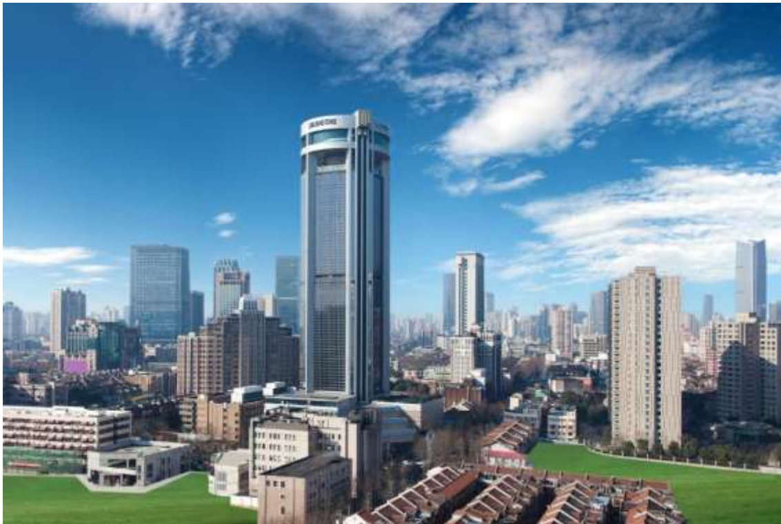
HOTEL SHANGHAI JIN JIANG TOWER 5* O SIMILAR

Precios, servicios y demás información de los productos detallados en esta página y en el sitio web www.samarmagictours.com no son vinculantes y pueden cambiar sin previo aviso