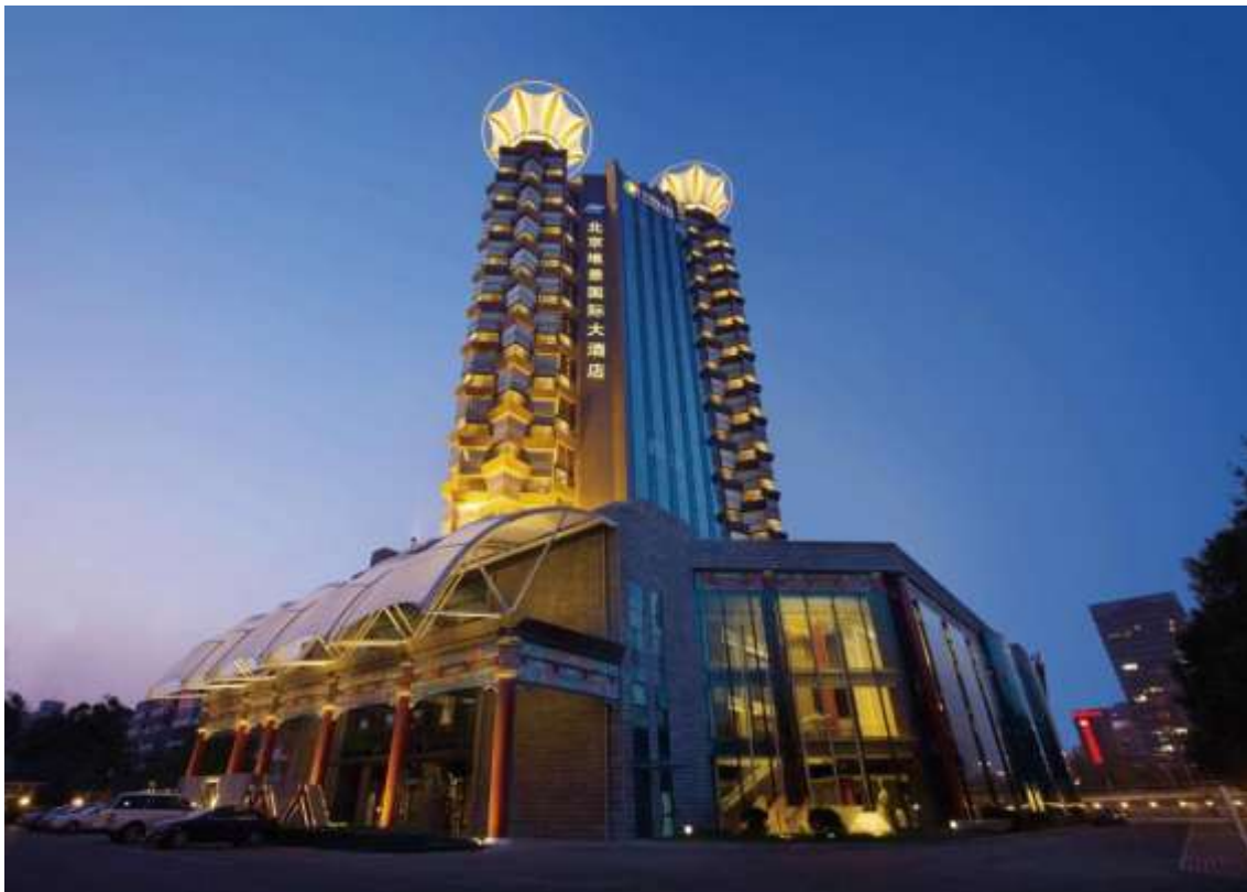
HOTEL BEIJING GRAND METROPARK 5* O SIMILAR

Precios, servicios y demás información de los productos detallados en esta página y en el sitio web www.samarmagictours.com no son vinculantes y pueden cambiar sin previo aviso